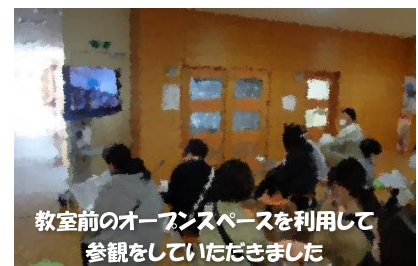
教室前のオープンスペースを利用して参観をしていただきました

安全メールへの登録ありがとうございます。災害や急な行事予定の変更、コロナ関連等で有効な連絡手段の一つとして活用させていただきます。今後の機種変更等で登録が切れてしまった場合など、お困りの際は学校へご連絡ください。