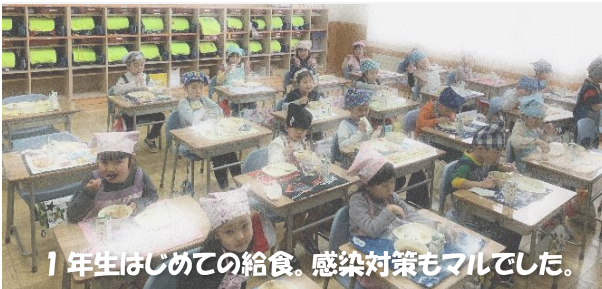
1年生はじめての給食。感染対策もマルでした。