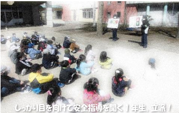
しっかり目を向けて安全指導を聞く1年生。立派！