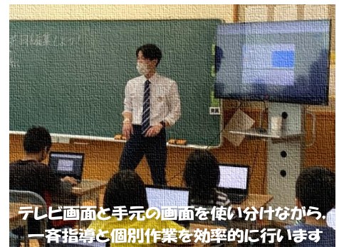
テレビ画面と手元の画面を使い分けながら、一斉指導と個別作業を効率的に行います