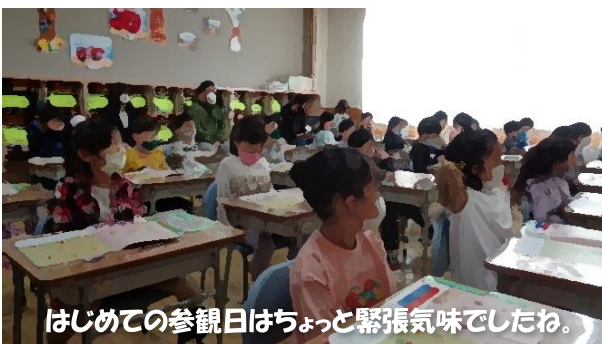
はじめての参観日はちょっと緊張気味でしたわ。