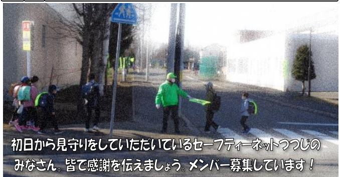
初日から見守りをしているセーフティネットつつじのみなさん。皆で感謝を伝えましょう。メンバー募集しています！