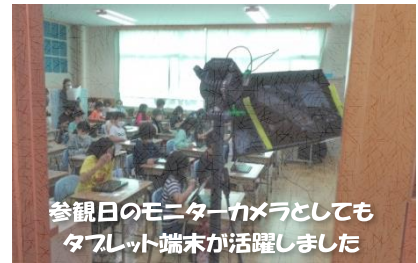
参観日のモニターカメラとしてもタブレット端末が活躍しました