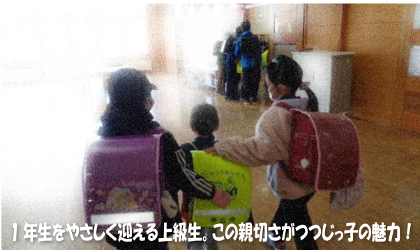
1年生をやさしく迎える上級生。この親切さがつつじ子の魅力！