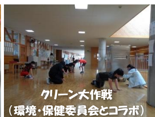
グリーン大作戦 (環境・保健委員会とコラボ)